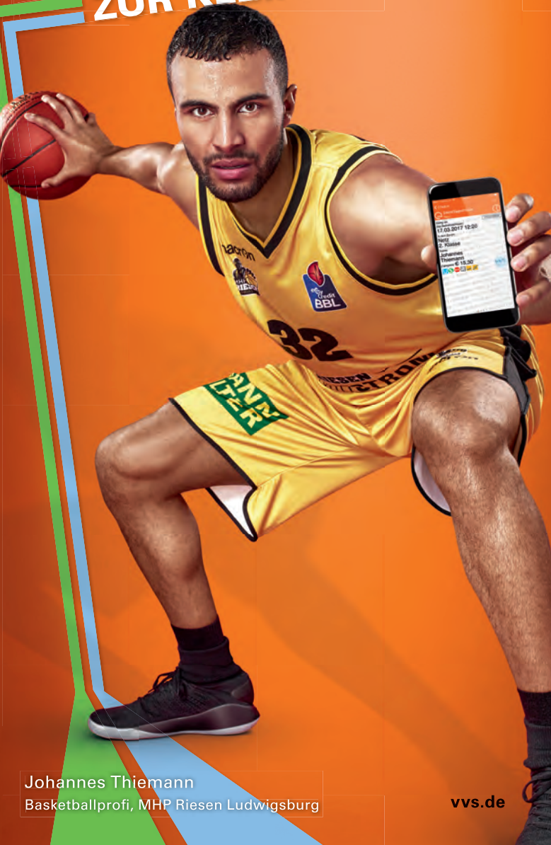
Johannes Thiemann Basketballprofi, MHP Riesen Ludwigsburg

WER'S DRAUF HAT, MACHT TICKETS KAUFEN ZUR KLEINIGKEIT.