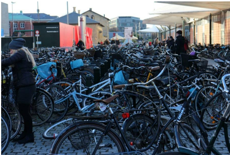
Ein Fahrrad gehört quasi zum Leben in Kopenhagen dazu!

Öffentlicher Verkehr in Kopenhagen ist sehr teuer. Wer nicht täglich auf Metro/Bus oder Bahn zurückgreifen will und auf eine recht teure Monatsfahrkarte verzichten will, kann sich eine Rejsekort anschaffen (Kosten 80DKK) und diese wie eine Prepaid Karte immer wieder aufladen. Praktisch ist, dass wenn man außerhalb der Stoßzeiten reist man einen reduzierten Preis zahlt (für zwei Zonen allerdings immer noch 12DKK). Ich empfehle sich am Anfang des Aufenthaltes ein Rad zu besorgen. Überall in der Stadt sind Radwege ausgebaut und man kommt in jeden Stadtteil in 15 bis 20 Minuten, schneller als mit dem Bus oder der Bahn!