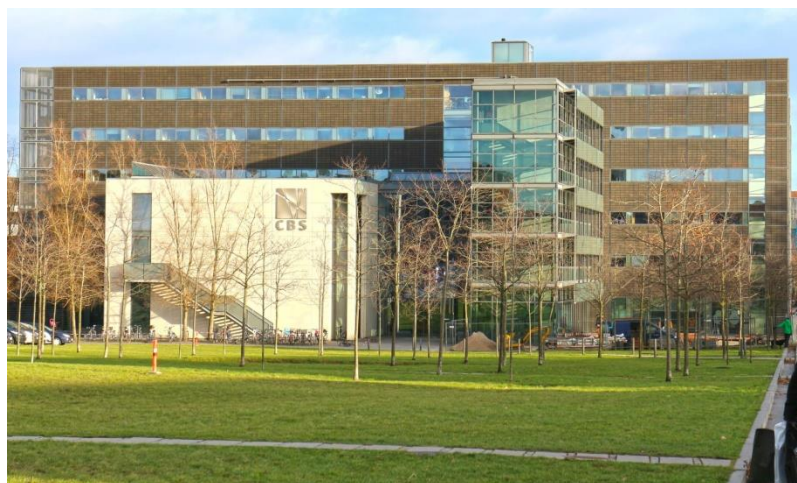
CBS main building (Solbjerg Plads)

CBS Studenten beantragen zu Beginn des Semesters eine eigene Student-ID (Automat im 1. Stock der Bibliothek) inklusive persönlicher ID-Nummer und Bibliothekszugangsdaten. Die ID dient auch als Bezahlkarte für Kopierer die überall an der CBS zu finden sind. Die