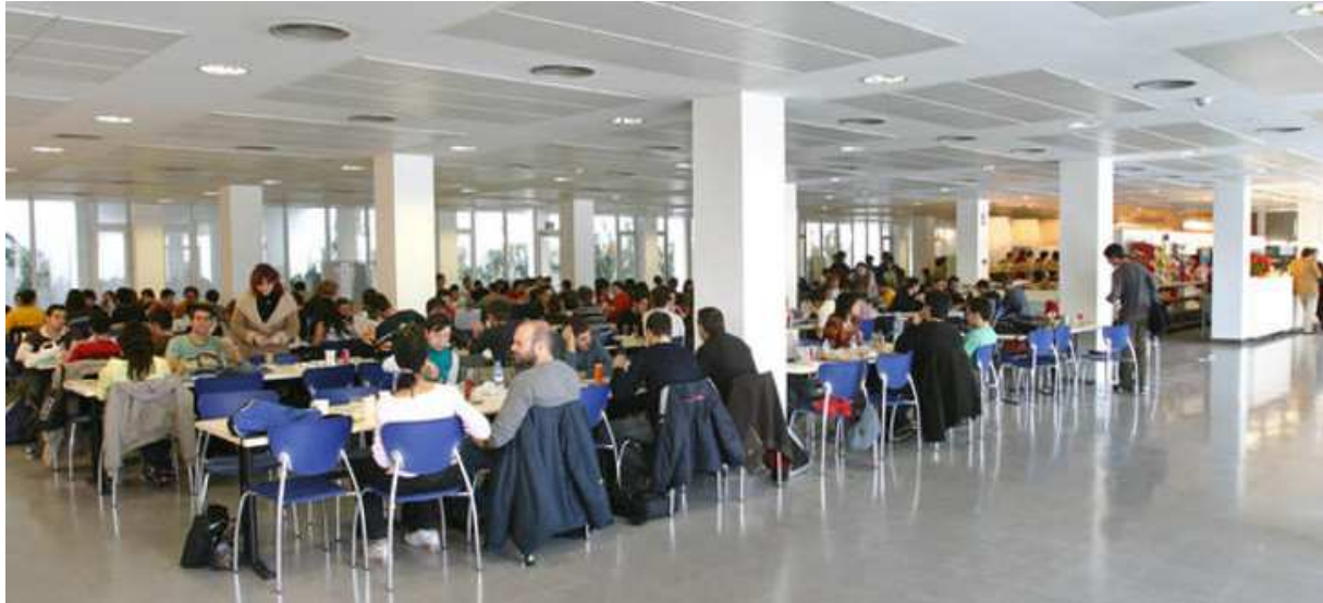
Abbildung 4: Cafeteria

Die Cafeteria der UPC bzw. EETAC befindet sich direkt auf dem Campus del Baix de Llobregat in Castelldefels. Man kann sich von morgens bis abends in der Cafeteria aufhalten, wobei es nur zwischen 13 und 15 Uhr Mittagessen gibt. Das Mittagessen in der Cafeteria ist relativ teuer. Es wird täglich ein Tagesmenü angeboten, das zwischen 7,50€ und 8€ kostet. (die Portionen sind aber sehr groß)