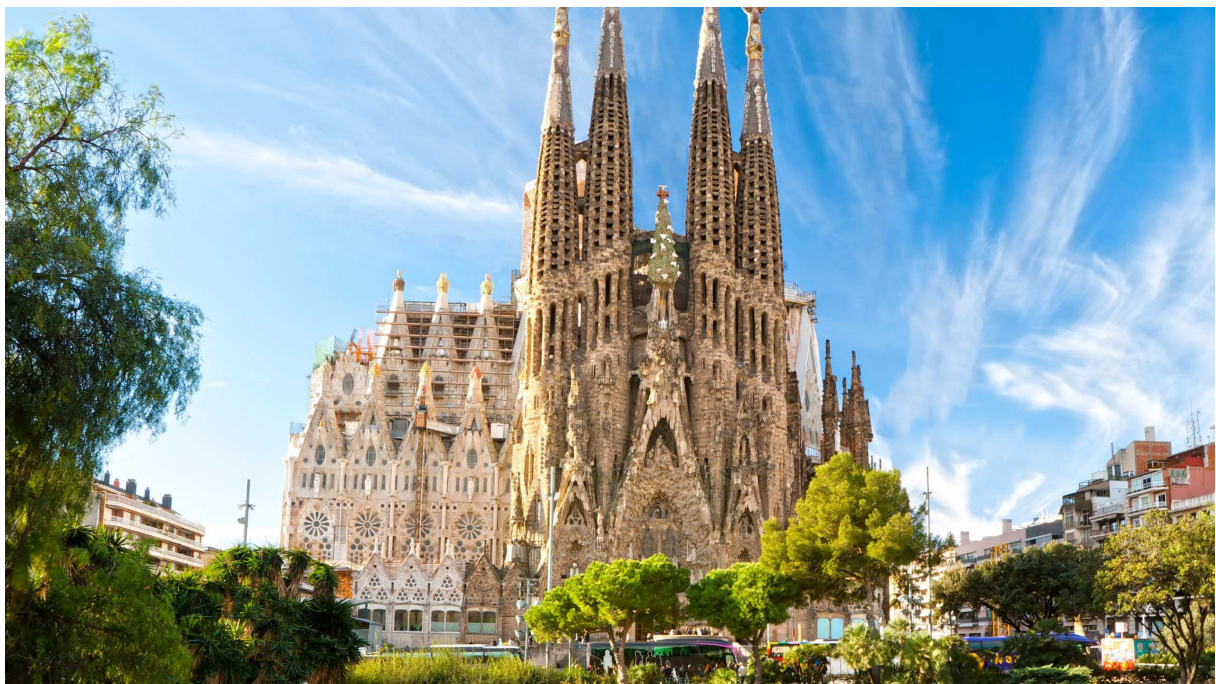
Abbildung 7: La Sagrada Família

Barcelona ist eine Stadt, in der man so gut wie alles machen kann. Man kann zu verschiedenen Sportveranstaltungen des FC Barcelona gehen, Sight-Seeing Touren durch die schöne Stadt machen und in Bars, Restaurants oder Discos gehen. Es ist sehr empfehlenswert frühzeitig mit der Besichtigung der Stadt zu beginnen, da es extrem viele Sehenswürdigkeiten gibt. Die folgende Abbildung zeigt eine der bekanntesten und beliebtesten Sehenswürdigkeiten in Barcelona: La Sagrada Família.