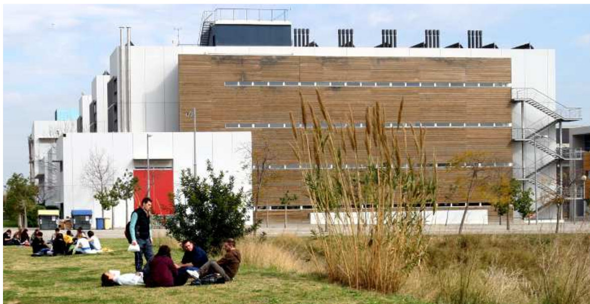
Abbildung 3: Abbildung 2: Campus del Baix de Llobegrat