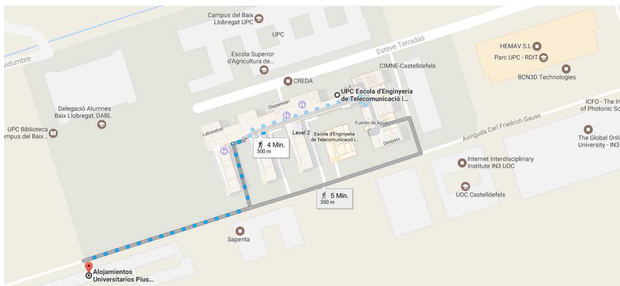
Abbildung 6: Distanz zwischen Wohnheim und EETAC