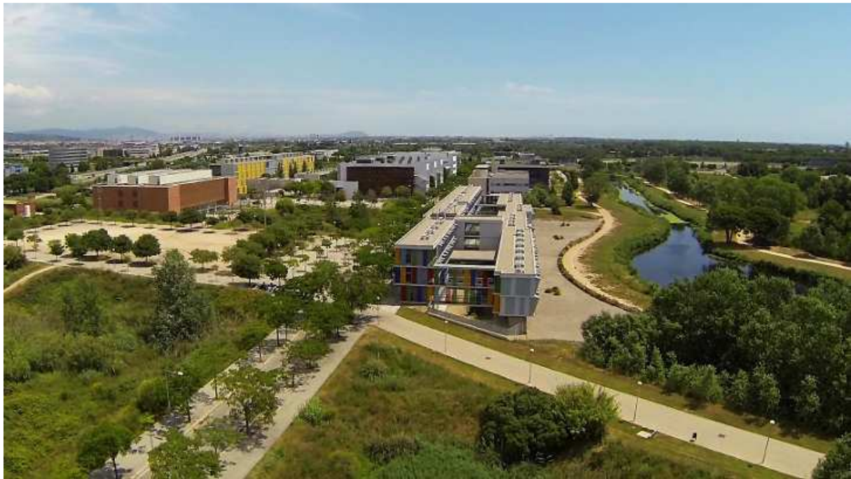
Abbildung 2: Campus del Baix de Llobegrat