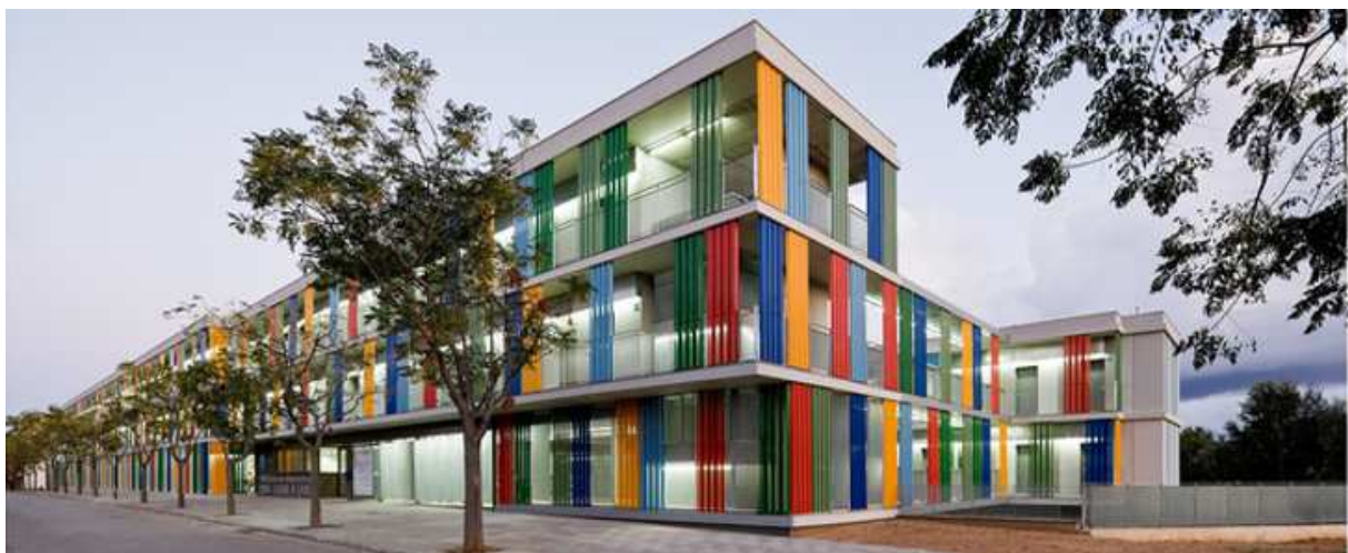
Abbildung 5: Unterkunft RESA - Residencia universitaria para estudiantes Pius Font i Quer

Die Wohnungssuche in Barcelona ist nicht sehr einfach. Ich persönlich habe in dem Wohnheim genau neben der EETAC in Castelldefels gewohnt. Das Wohnheim (RESA - Residencia universitaria para estudiantes Pius Font i Quer) ist relativ neu und modern. In dem Wohnheim gibt es ein Fitnessstudio und einen großen Aufenthaltsraum mit Billard, Tischtennis und Tischkicker. Man konnte das möblierte Apartment für einen beliebigen Zeitraum mieten, wobei die Apartments sehr klein sind. Monatlich kostet die Unterkunft zwischen 400 und 500 € (je nach gewünschter Ausstattung).