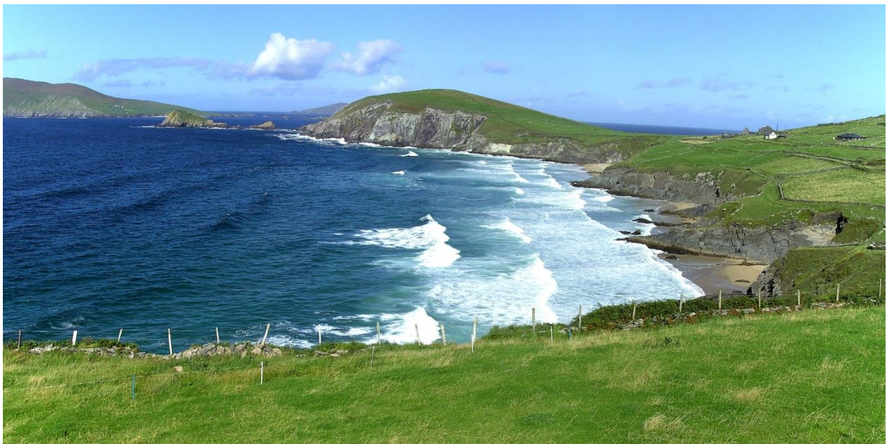
Bild: Ring of Kerry, Ireland