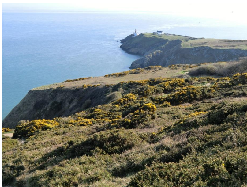
Bild: Howth, Ireland

Howth ist eine Halbinsel, welche im Norden Dublins liegt. Ich empfehle mit dem Bus nach Howth zu fahren, da ihr mit dem Doppeldecker Bus in die gepflegten Vorgärten der etwas gehoberen Gesellschaft hineinspicken könnt und es eine sehr schöne Fahrt nach Howth mit dem Bus ist. Falls ihr nicht mit dem Bus nach Howth fahren wollt, fährt dort hin auch eine DART. Howth eignet sich auch wunderbar, um eine kleine Wanderung zu unternehmen und auf das weite Meer mit den steilen Klippen hinauszuschauen. Abends könnt ihr, zum Beispiel, in dem kleinen Hafen etwas essen. Unten auf dem Bild könnt ihr gelbe Blumen erkennen. In ganz Irland gibt es diese gelben Blumen (leider weiß ich den Namen nicht). Falls ihr die Begegnung mit solchen gelben Blumenbüschen macht, müsst ihr einmal hin riechen, denn diese Blumen duften nach einer Mischung aus Honig und Mandel :D.