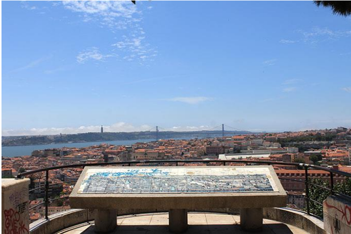
Miradouro da Senhora do Monte

https://www.playocean.net/i/portugal/lisboa/miradouros/miradouro-da-senhora-do-monte/miradouro-da-senhora-do-monte-1.jpg