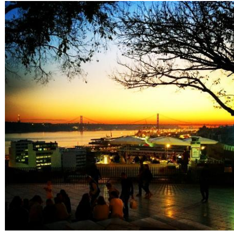
Miradouro de Santa Catarina

https://www.playocean.net/i/portugal/lisboa/miradouros/miradouro-da-senhora-do-monte/miradouro-da-senhora-do-monte-1.jpg