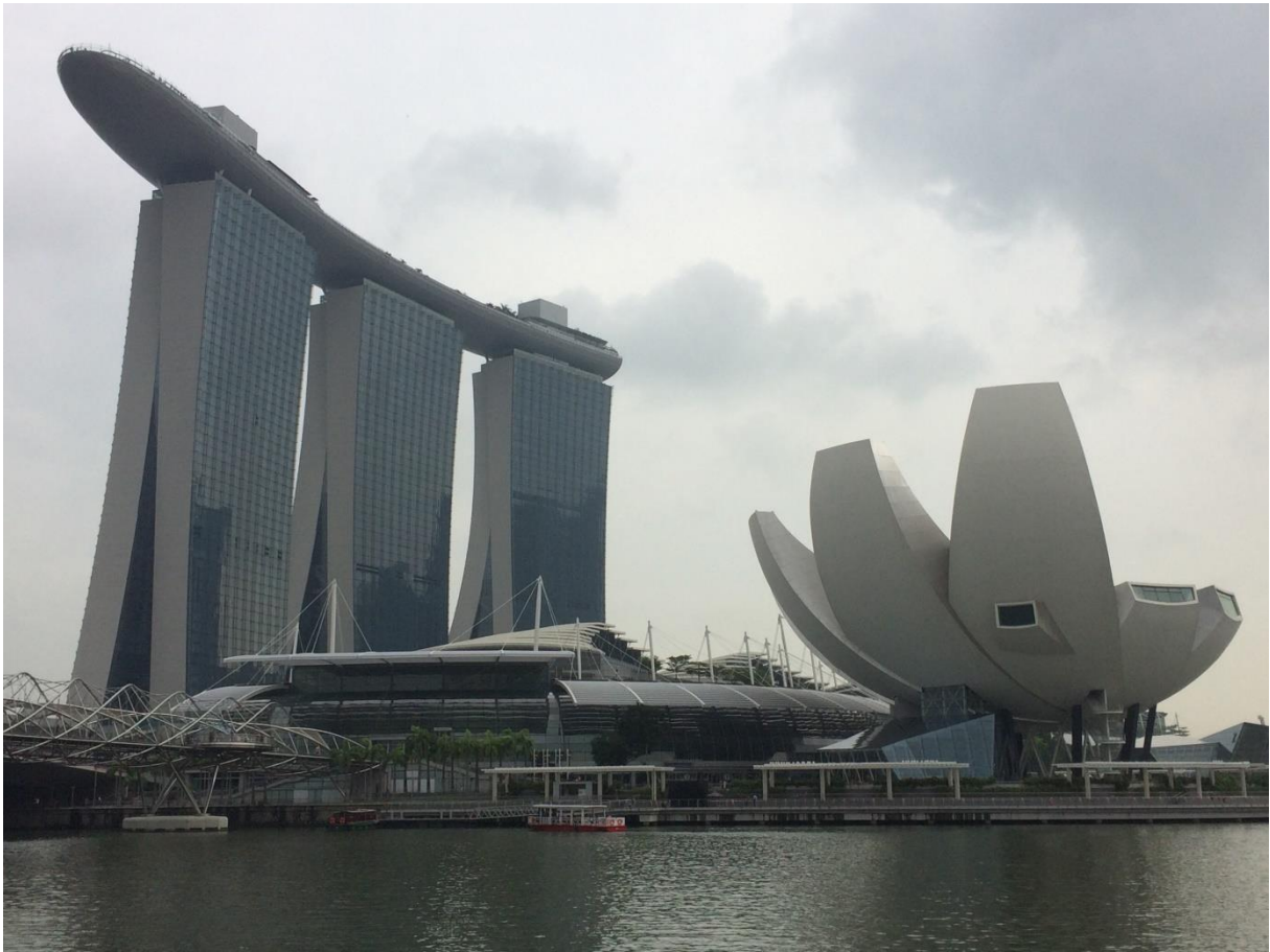
Abbildung 3: Marina Bay Sands