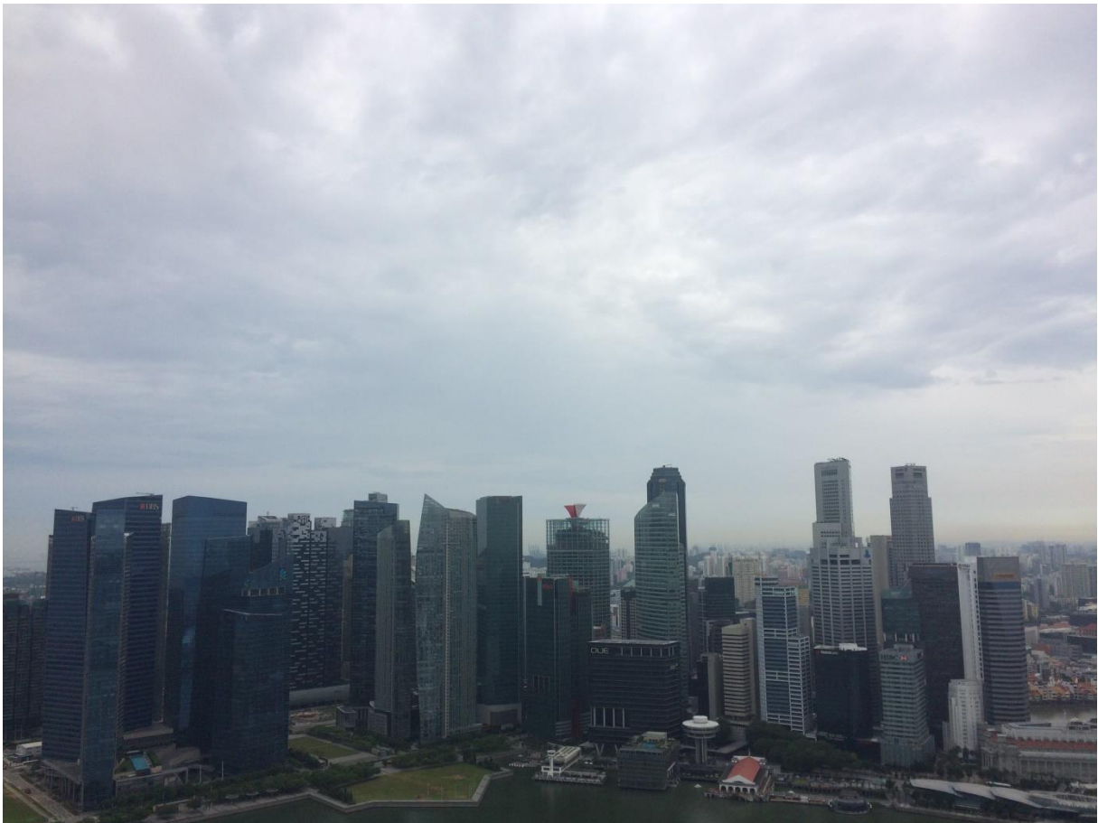
Abbildung 2: Skyline Singapur