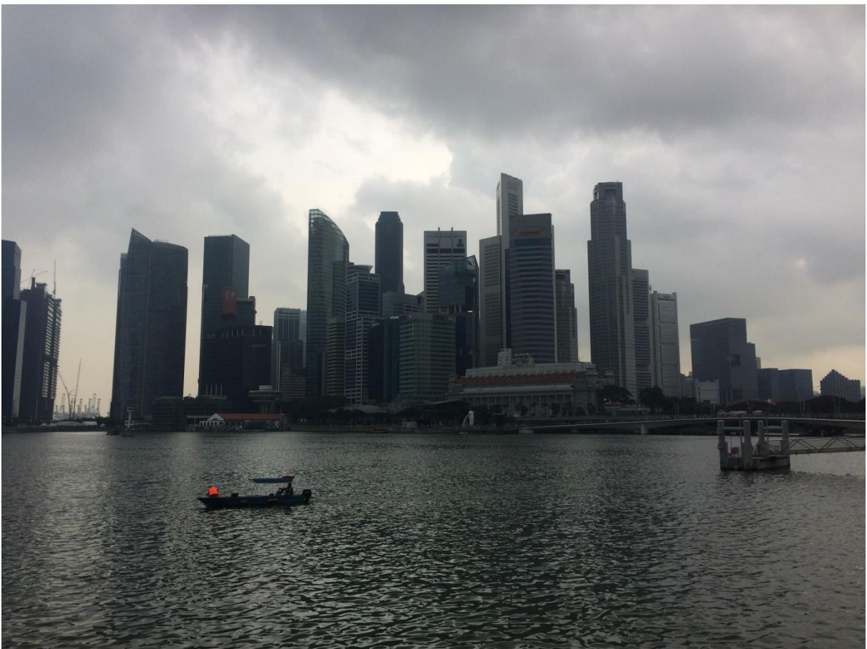
Abbildung 4: Financial District