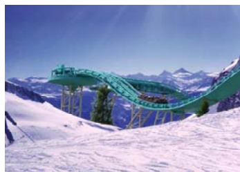
Der Schnee und die Rutsche Plaine Morte, Wallis, Schweiz