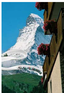
Die Bob-Bahn am Matterhorn, Zermatt, Wallis, Schweiz