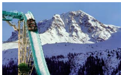
Die Wasserfahrt im Winter Graubünden, Schweiz