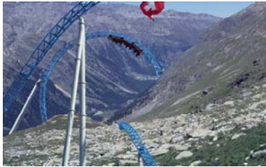
Die blaue Serpentine Alpen, Schweiz