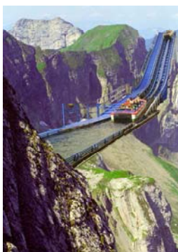
Flutwelle am Pilatus Pilatus bei Luzern, Schweiz