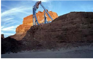
Hinter dem Felsen versteckt Sinai-Wüste, Ägypten